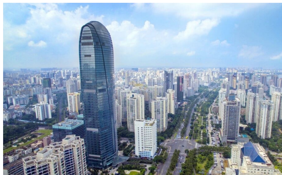
海口希尔顿酒店大厦,高度249.7米。