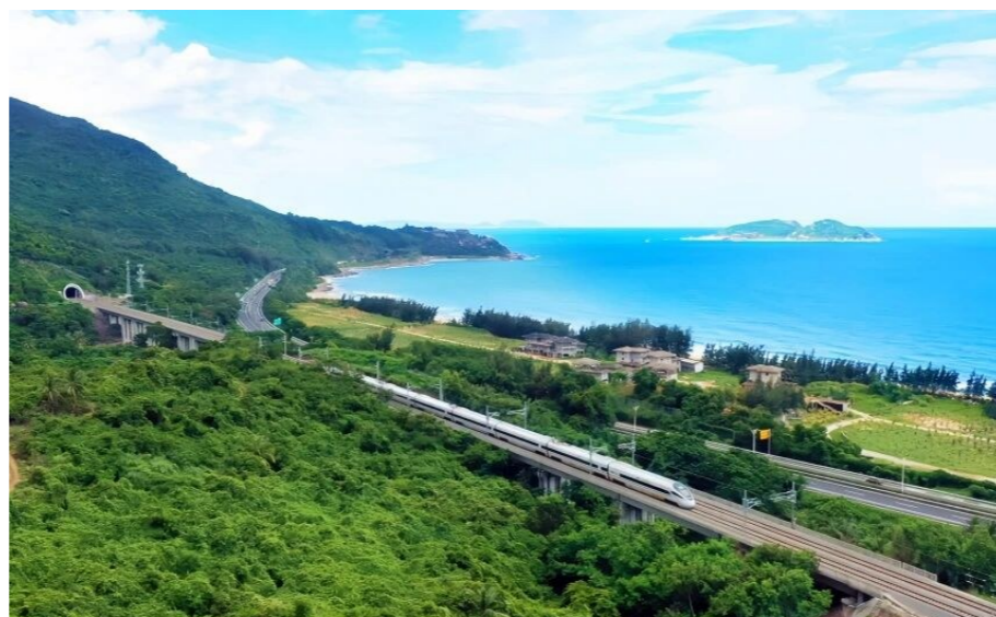
海南环岛高铁,世界首条环岛高铁。